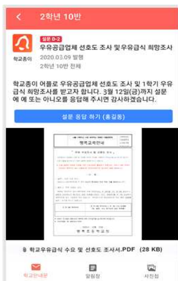
< 학교안내문 게시글 확인 >