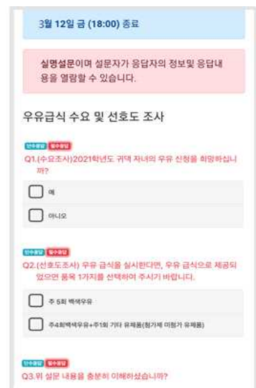
< 회신 응답 모습 >