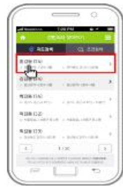
④ 성범죄자 확인