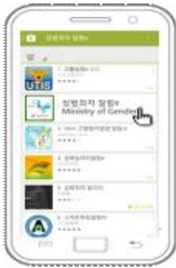
① 앱스토어에서 '성범죄자 알림e' 앱