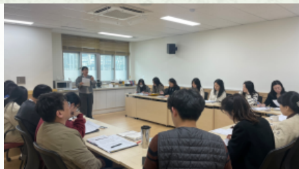
3월 12일 교과연구회 질문형성기법에 대한 교육나눔 활동