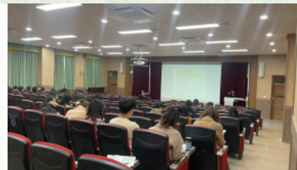
3월 21일 전문적학습공체 질문하는 효천 1단원 안내