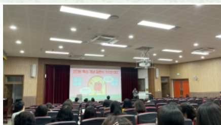
3월 6일 교무회의 질문교육에 대한 개념 이해 활동