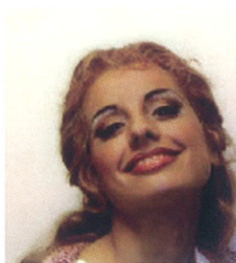
소프라노: 이반나 스페란자