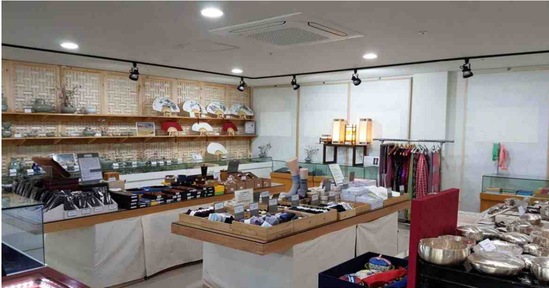
명품관 - 명인명장상품판매관