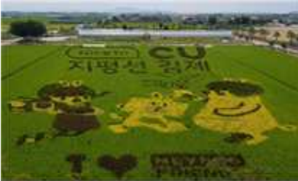
④ 지평선 대지아트