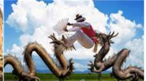
⑥ 지평선 줄타기