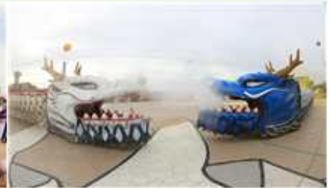
③ 벽골제 쌍룡놀이