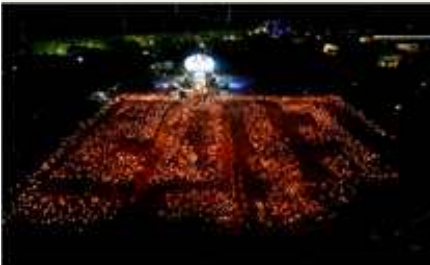
① 벽골제 햇불 퍼레이드