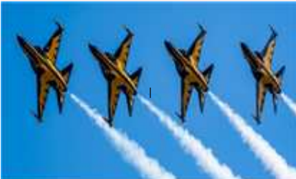
⑩ 블랙이글스 '에어쇼'