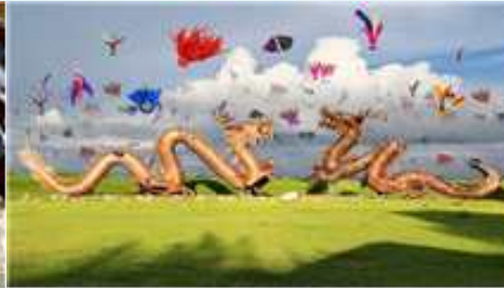
⑧ 도전!2033 글로벌 제기차기