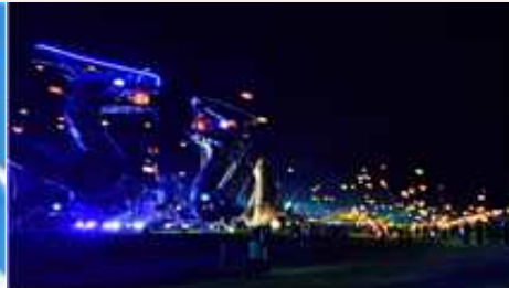
⑪ 희망 LED풍선 날리기