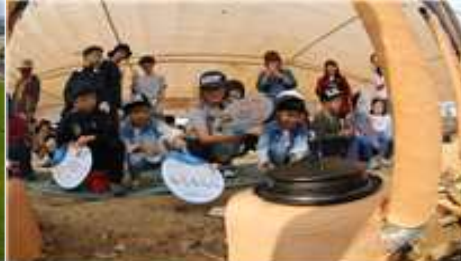
⑤ 아궁이 쌀밥짓기 체험