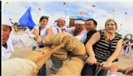
② 풍년기원 입석줄다리기