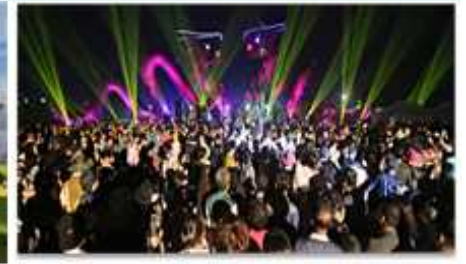
⑨ 지평선 파사드 판타지쇼