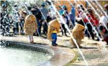
⑦ 도롱이 워터터널