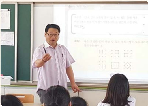
▲ 일과전 - 과목보충