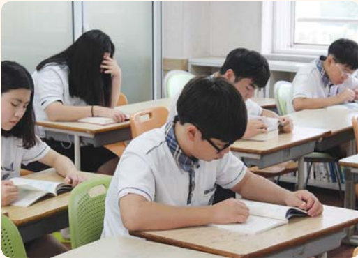
▲ 일과전 - 기초학력