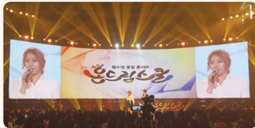
▲ 2016.6.26. 청소년 공상 콘서트 온드림스쿨