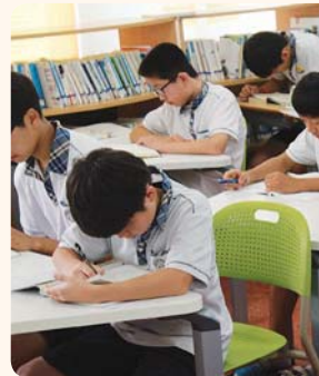
▲ 일과전 독서지도 모습