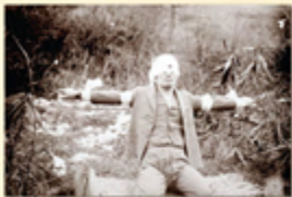
순국한 윤봉길 의사