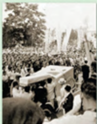
1946년 7월 7일 국민장으로 거행된 윤봉길·이봉창·백정기 세 분의 장례식