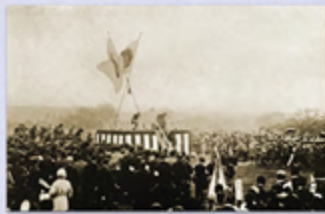
거사 후의 행사장 모습