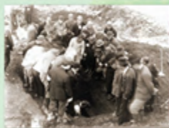
윤봉길 의사 유해 발굴 장면

나라를 되찾게 되자, 독립운동을 하다 돌아가신 분들의 유해를 찾아오려는 노력이 펼쳐졌습니다. 1946년 3월, '임시정부유해발굴단'은 가나자와에 가서 윤봉길 의사의 시신을 찾기 위해 노력했습니다. 그러던 사흘째, 땅에 묻을 때 불경을 읽었다는 각존원(覺尊院)의 야마모토 료도(山本 了道)라는 여승의 고백으로 드디어 정확한 장소를 알 수 있게 되었습니다. 그곳은 육군묘지로 가는 통로로, 발굴단이 휴식처로 사용하던 곳이었습니다. 윤봉길 의사를 화장했다고 거짓으로 알려놓고 몰래 사람들이 다닌 길에 묻어두어 그 시신조차 찾지 못하게 한 것이지요. 하지만 양심 있는 일본인의 고백으로 늦게나마 윤의사의 유해를 찾아 고국으로 모셔올 수 있었습니다.