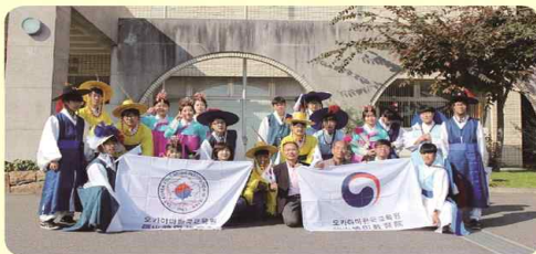
일본 오카야마현 현립 다카마츠(高松) 농업고등학교와 교육 문화 교류