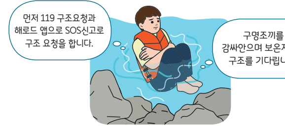
구명조끼를 강싸안으며 보온자세로 구조를 기다립니다.