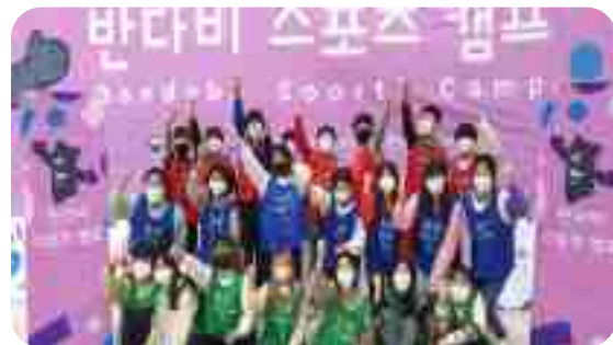
[ 반다비 스포츠 캠프 ]