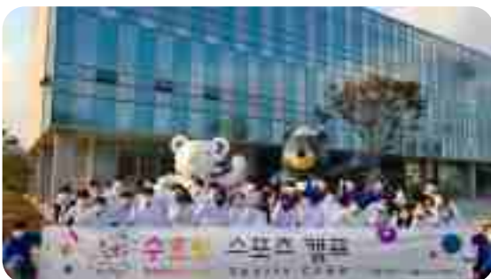
[ 수호랑 스포츠 캠프 ]