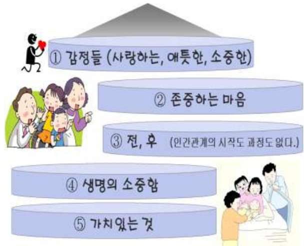
◀◀ 성매매에는 없는 것

음란물은 매우 선정적이고 자극적이기 때문에 특히 청소년기에 이런 음란물에 빠지게 되면 점점 더 현 실과 환상을 혼돈하게 되고 자신도 모르게 점점 빠져들게 되면서 무감각해집니다. 우리 아이들이 음란물에 물들어 되돌릴 수 없는 행동을 하게 되지 않도록 가정에서 음란물에 대한 적극적인 관리가 필요합니다.