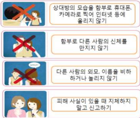
◀◀ 성 인권 행동지침

신체적으로 상대방을 괴롭히거나 만지는 행동, 그리고 상대방의 몸에 대해 놀리는 등 수치심을 주거나, 다른 사람에게 음란물 등 성적으로 불쾌감을 주는 영상, 사진 등을 보여주는 것 모두 성희롱에 해당될 수 있습니다.