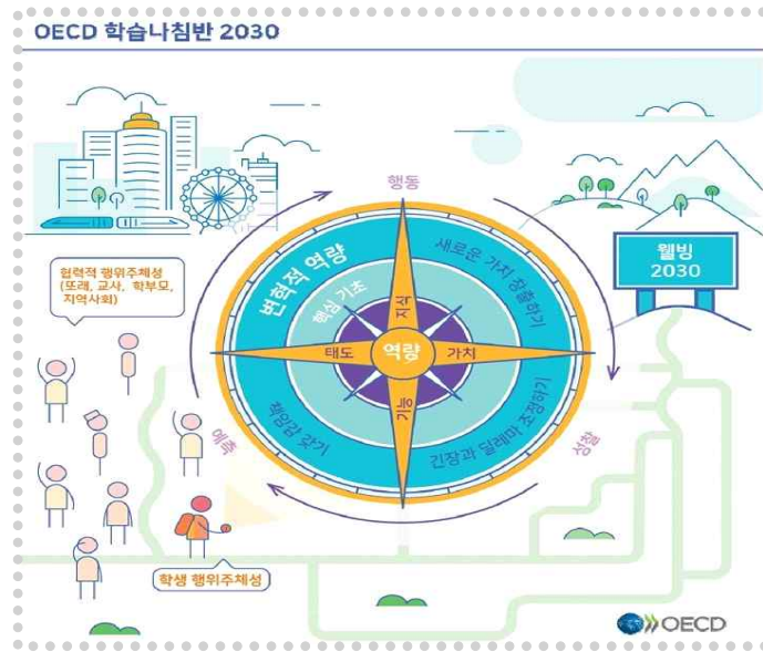
〈그림 2-2〉 OECD 학습나침반 2030

OECD 교육 2030에서는 불확실하고 복잡한 특성을 갖는 미래사회에서 보다 나은 미래를 만들어 가는 능력을 강조하며 변혁적 역량을 제시하였다. 이는 학생들이 자신의 관점을 성찰하면서 형성해 가도록 하고 변화하는 세상에 기여하는 방법적 측면에서 변혁적 역량으로 이해할 수 있다.