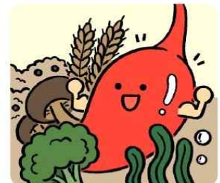
신선한 채소, 해조류로 위장을 튼튼하게 해요!