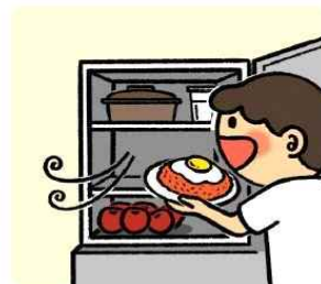
바로 먹지 않는 음식은 냉장고에 보관해요!