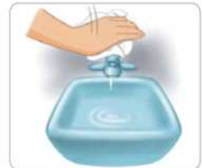
8 종이타월로 수도꼭지를 잠근다