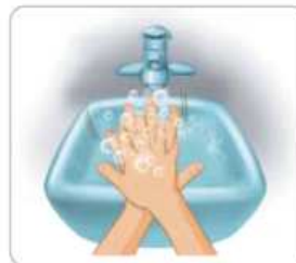
3 손바닥으로 다른 손의 손등을 닦는다