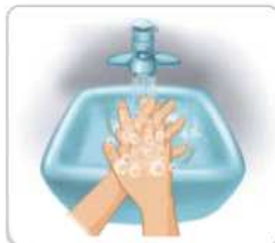
2 손바닥을 마주하고 깍지껴서 닦는다