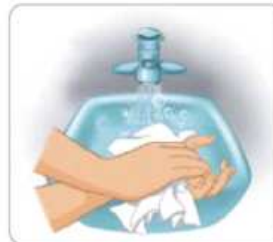
7 종이타월로 물기를 닦는다