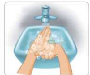
4 손가락을 돌려 닦는다