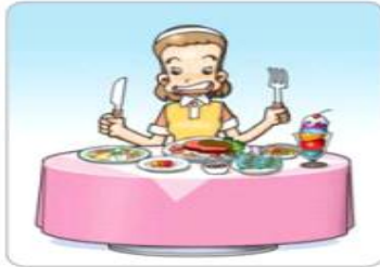
음식 먹기 전