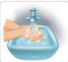
1 흐르는 물에 손을 적시고 비누를 바른다