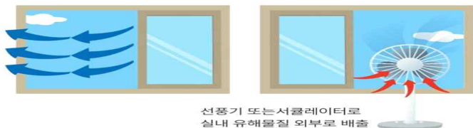
선풍기 또는 서큘레이터로 실내 유해물질 외부로 배출