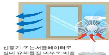
선풍기 또는 서큘레이터로 실내 유해물질 외부로 배출