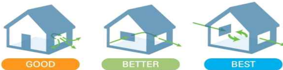
[ 자연환기 방식별 환기효과 비교 ]