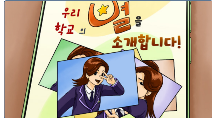
학교폭력 예방교육 동영상(중등용)