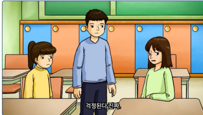
학교폭력 예방교육 동영상(초등용)

학교폭력 예방교육 동영상은 통해 학교폭력이 무엇인지, 학교폭력을 경험했을 때 어떻게 행동해야 하는지를 학습할 수 있습니다.