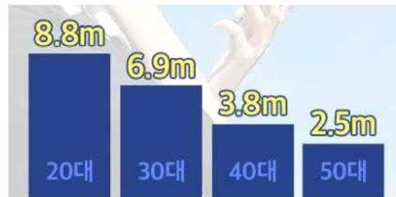
<보행 중 스마트폰 사용+음악감상 시 인지거리>