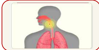
갑자기 발생한 인두염, 인후통