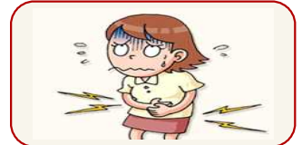
복통, 메스꺼움, 구토