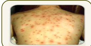
온몸의 수포성 발진