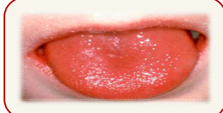
2~3일 후 : 붉은 딸기모양 혀