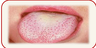
질병초기 : 흰 딸기모양 혀