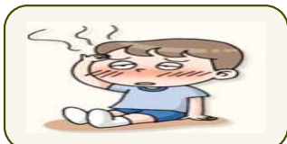
가벼운 몸살 (미열, 권태감)