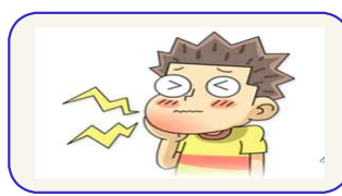
귀밑 침샘 부어오름, 통증