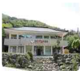
세계 유일의 가위박물관