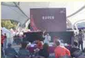
홍삼 대방출 할인 한정판매