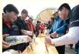
술이 아닌 약 홍삼주 담그기 체험