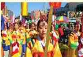
왕의 기운 뽕금척 퍼레이드