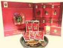
진안군수 품질인증 진안홍삼