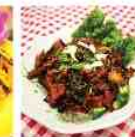
홍삼 돼지고기 두부찌기