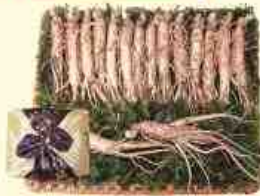
건강한 맛 진안고원 인삼