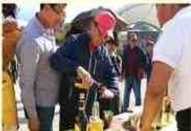
나만의 홍삼 칵테일 만들기