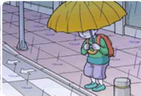
바르지 않은 모습