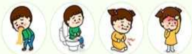
구토 설사 복통 발열