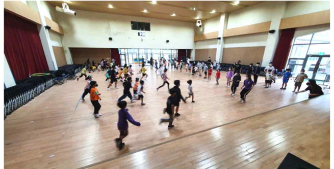
우리가 만드는 행안 올림픽