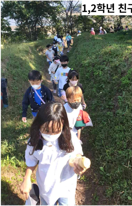
1,2학년 친구와 마실길 걷기