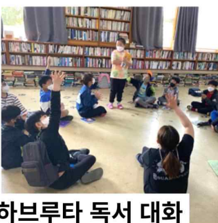
하브루타 독서 대화