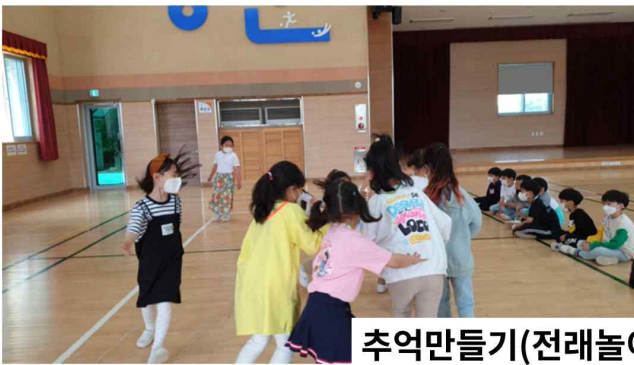
추억만들기(전래놀이, 이야기 들려주기)