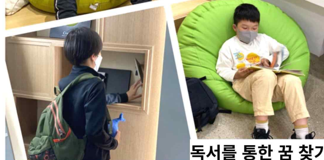
독서를 통한 꿈 찾기