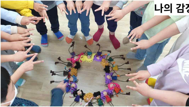
나의 감정 마주하기