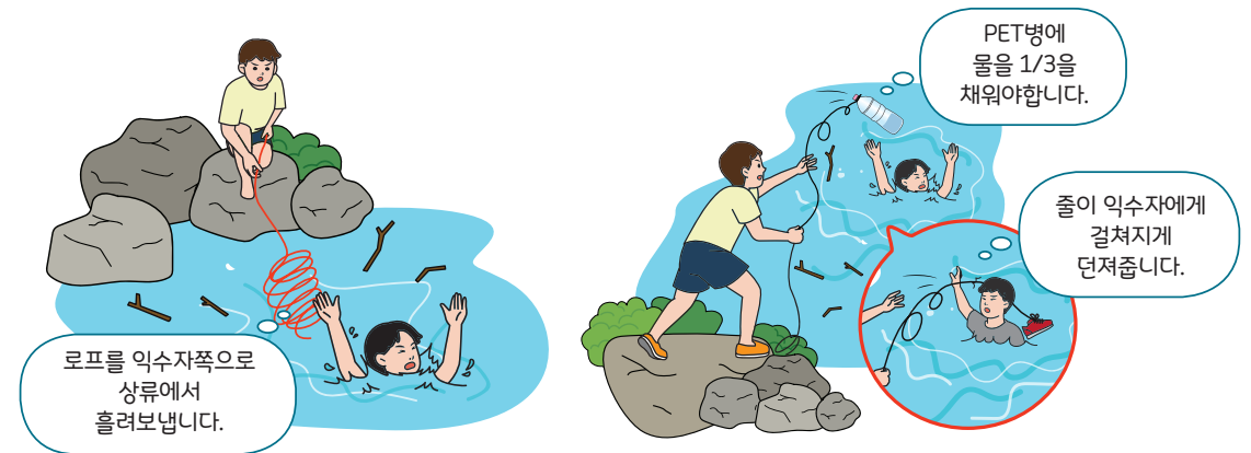
< 긴 로프를 활용한 구조법 >