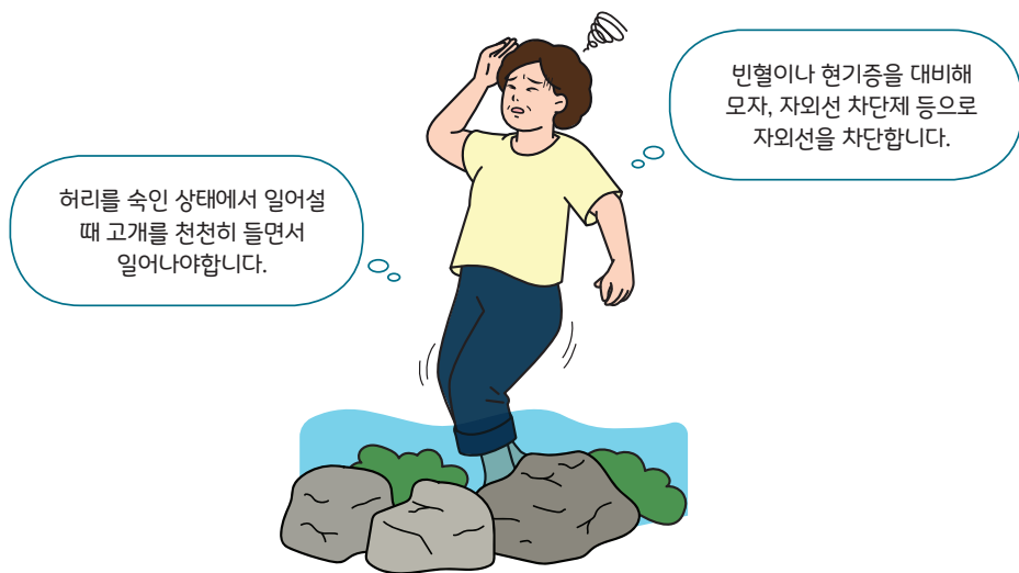
< 빈혈, 현기증 유의사항 >