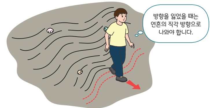
< 갯벌에 있다가 갑자기 안개(해무)가 끼는 경우 탈출요령 >