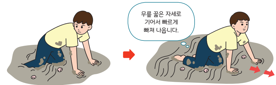
< 갯벌에 발이 무릎 이하로 빠진 경우 탈출요령 >