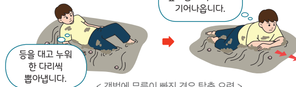
< 갯벌에 무릎이 빠진 경우 탈출 요령 >