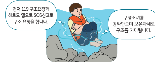
< 구조 전까지 체온유지(보온) 자세 >