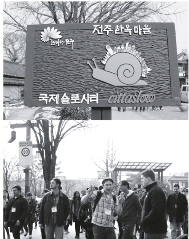
▲ 전주 한옥 마을과 외국인 관광객