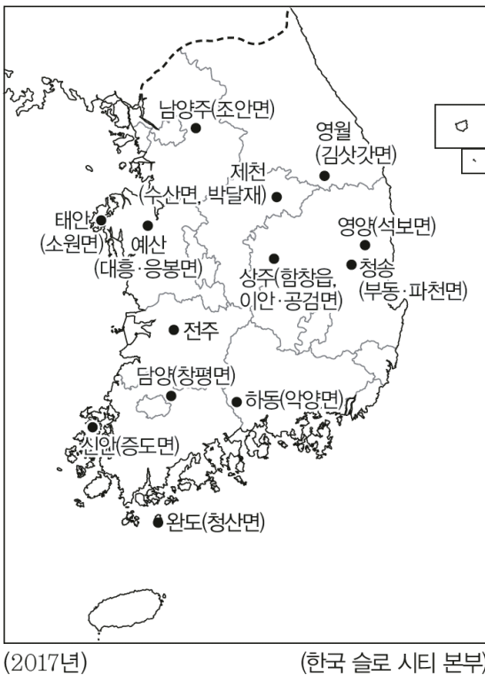
▲ 우리나라의 슬로 시티

슬로 시티(slow city)는 ‘유유자적한 도시’, ‘풍요로운 마을’이라는 뜻의 이탈리아어 ‘치타슬로(cittaslow)’를 영어로 표현한 것으로, 급변하는 사회 속에서 느리고 여유로운 삶을 지향하며 자연환경과 문화 보존을 바탕으로 지역을 매력적인 장소로 만들기 위한 운동이다. 따라서 슬로 시티는 지역의 정체성과 고유성을 지키면서 관광 산업을 발전시키는 계기가 된다. 슬로 시티로 지정되려면 생태 환경이 보전되어 있어야 하며 ‘슬로푸드’가 될 만한 유기농 특산물이 있어야 한다. 1999년 국제 슬로 시티 운동이 출범한 이래 우리나라에 지정된 슬로 시티는 김해시와 서천군을 포함하여 2018년 8월 기준 총 15개 지역이며, 세계적으로는 29개국 253개 지역으로 확대되었다.