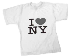
▲ 지역 브랜드화의 사례

지역화 전략에는 지리적 표시제, 장소 마케팅, 지역 브랜드화 등이 있다. 지리적 표시제 인증을 받은 상품에는 다른 지역에서 임의로 상표권을 이용하지 못하도록 하는 법적 권리가 주어지는데, 인도 다르질링 차, 프랑스 보르도 와인 등이 지리적 표시제의 대표적인 사례에 해당한다. 지역 브랜드화의 사례로는 뉴욕의 공식 슬로건인 'I♥NY'를 들 수 있다. 'I♥NY'를 홍보함으로써 뉴욕의 지역 정체성을 강화하고 지역 이미지를 향상시키는 효과를 얻을 수 있었다.