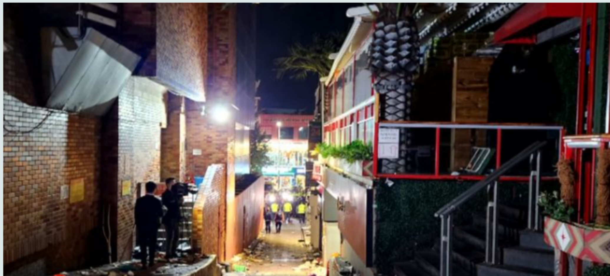
이태원 압사 사고현장의 모습

2022년 10월 29일 22시 15분경 서울특별시 용산구 이태원동 해밀톤호텔 부근에서 발생한 대형 압사 사고이다.