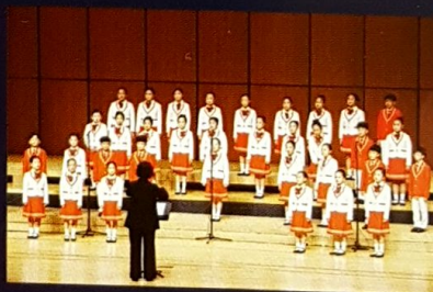
군산 YMCA 소년소녀합창단