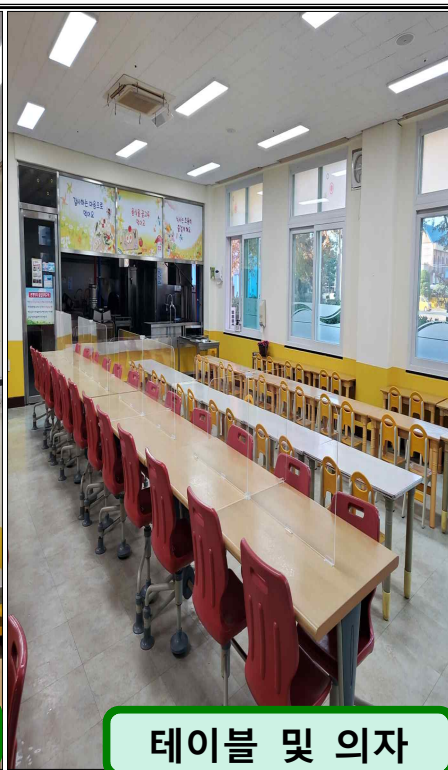
테이블 및 의자