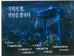
실감형 스토리영상 기적의 빛, 희망을 밝히다