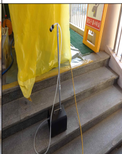
폐기물 반출구 #7