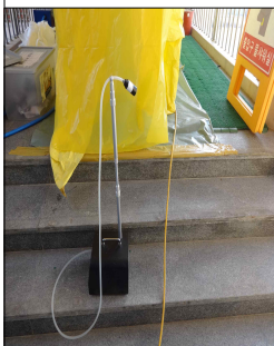
위생설비 입구 #6