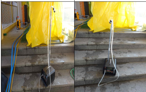
위생설비 입구 #6