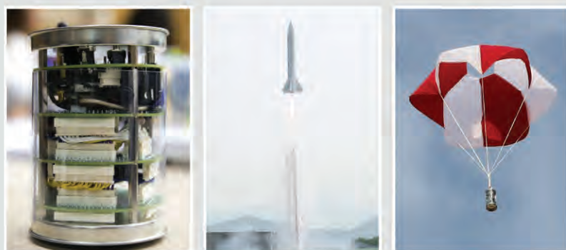
캔위성 제작 발사 운용 예

캔위성(Cansat)은, 1998년 스탠퍼드대학의 로버트 트윅(Robert Twiggs) 교수에 의해 제안된 교육용 모사 위성을 말하며, 발사 및 임무 운용에 필요한 위성 구성요소를 매우 단순하게 구성하여, 고공에서 짧은 시간 동안 위성처럼 운용하는 것이 특징입니다. 인공위성의 역할을 모사할 수 있도록, 구조계, 전력계, 데이터 처리계, 통신계, 탑재체 등 인공위성의 필수적 기능을 음료수 캔(예: 콜라 캔) 내에 구현한 것에서 명명(Can+Satellite)의 유래를 찾을 수 있습니다.