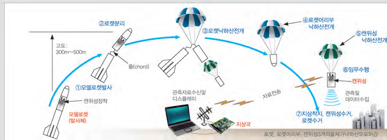
모델로켓을 이용한 캔위성 발사 및 운용 개념도

캔위성은 실제 위성처럼 우주로켓에 실려 지구궤도에 투입되는 것을 목표로 하지는 않습니다. 기구, 드론, 소형 모델 로켓 등을 활용하여 상공 수백 미터 고도까지 캔위성을 올려준 후 분리하면, 캔위성이 낙하산을 전개하여 서서히 고공에서 낙하하는 동안 위성처럼 사전에 계획된 일련의 임무를 수행하는 방식을 취합니다.