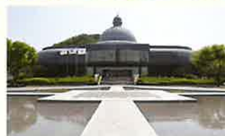
곤지암도자공원 Gyeonggi Porcelain Park