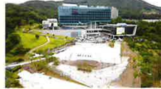
광주시청 다목적 광장 Gwangju City Hall Square

광주시 아름다운 자연환경과 문화유산을 활용하여 다양한 장소에서 펼쳐지는 소규모 밴드공연 Wind Band Festival at the Landmarks of Gwangju City