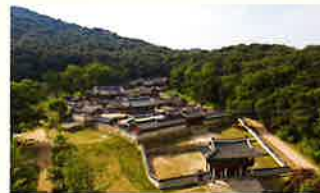
남한산성 Namhan Fortress