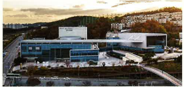
남한산성아트홀 Namhansanseong Art Hall