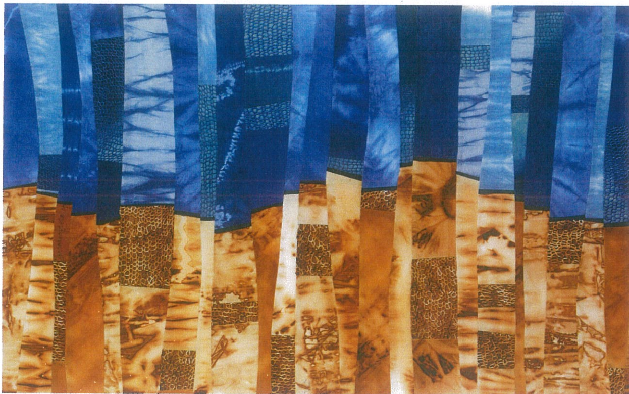
희망과 공존 | 사이즈: 90x60cm | 소재: 인디고페라, 녹염, 면, 실