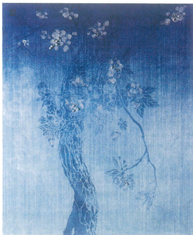
니람 꽃에 스미다 | 사이즈: 67x55cm | 소재: 니람, 은분, 은

달보드레공방 대표 / 한국천연염색화(繡)교육원 포항지부 / 한국천연염색형염연구회 총무 / 2023 한국천연염색형염연구회 정기회원전(경인미술관, 서울) / 2022 제17회 한국 천연염색 박물관 50인 초대전(한국천연염색박물관, 나주), 한국천연염색형염연구회 - 천연염색화(繡), 나주에서 꽃피다.(한국천연염색박물관, 나주), 한국천연염색가족연구회 - 가족 자연을 담다(한국공예관, 청주) / 2021 한국천연염색형염연구회 창립전 - 삼원(三圓) 형지(型紙)를 만나다(가회민화박물관, 서울) / 그 외 다수 그룹전