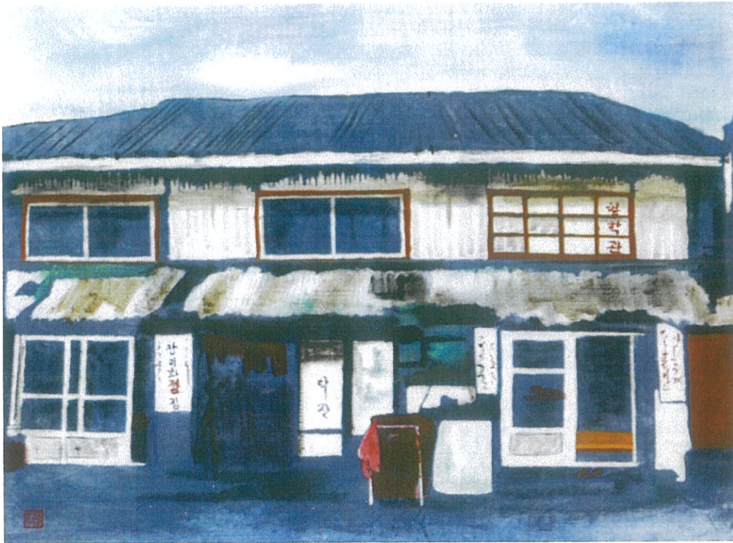
그림에도 불구하고 사이즈: 69x56cm 소재: 니람, 안료