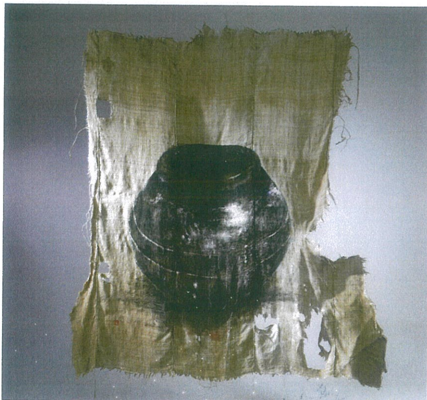
一心 | 사이즈: 152x150cm | 소재: 니랑, 감물, 호분, 삼베