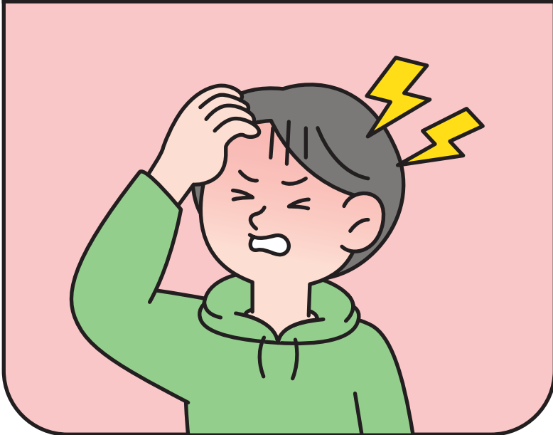
머리가 지끈, 짜증이 남