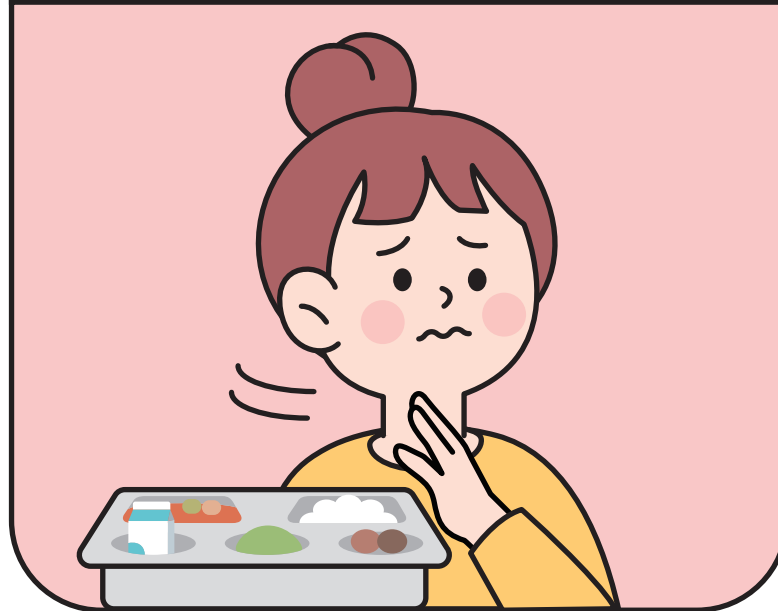
밥 맛이 없어짐