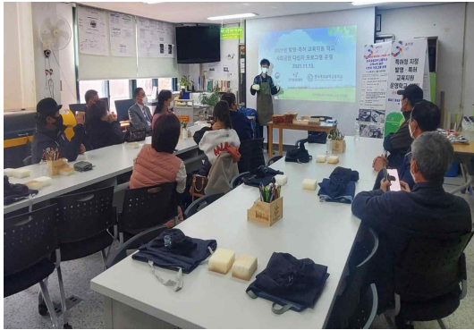
① 발명특허(지식재산) 개요 살펴보기