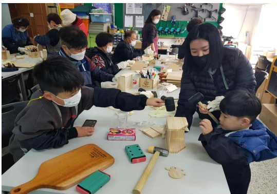
③ 작품 제작하기