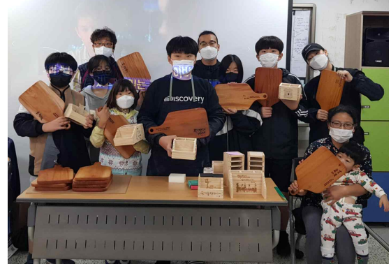
④ 작품 발표