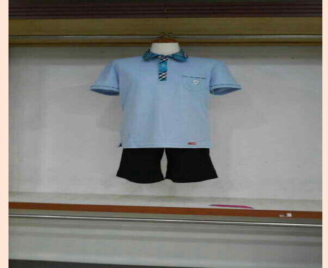
남·여학생 공용 (티셔츠-반바지)