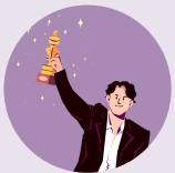
할리우드 배우 '짐 캐리'

미셸 오바마는 흑인 여성이라는 편견 때문에 '변호사'로서 힘든 나날들을 보낼 때마다 주변 사람로부터 지지를 구했으며, 스스로를 다독이고 현실적으로 장애물을 극복할 방법을 찾았습니다.