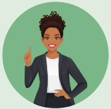
미국 변호사 '미셸 오바마'