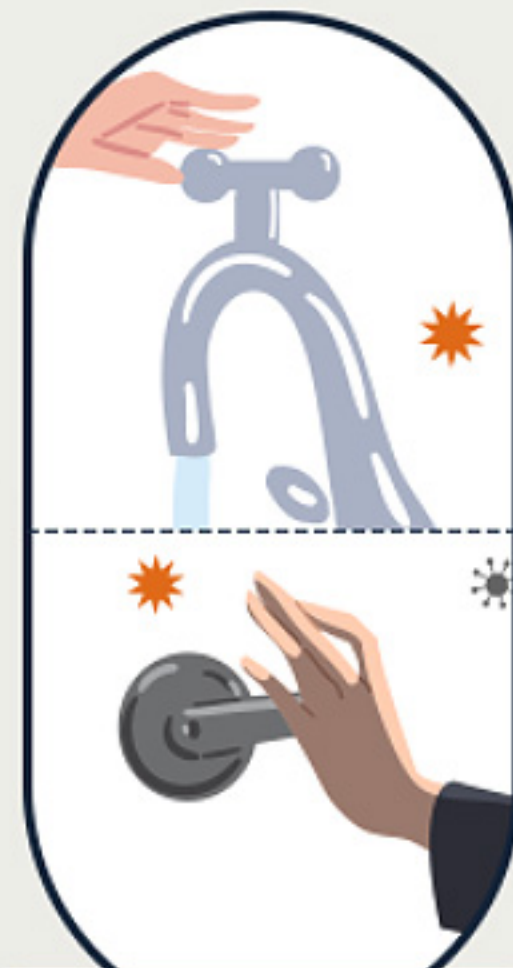
수도꼭지, 문고리 등 접촉

노로바이러스에 오염된 음식과 물을 섭취 하였거나, 환자 접촉 을 통한 사람 간 전파가 가능합니다. 또한, 노로바이러스에 감염된 환자가 손을 씻지 않고 만진 수도꼭지, 문고리 등을 손으로 만진 후 입을 만지거나 음식물 섭취 시 감염될 수 있습니다.