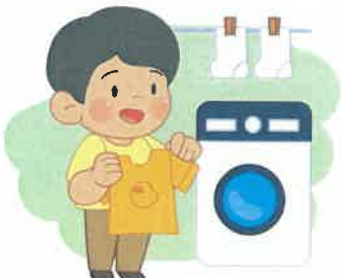
4 옷 털고, 세탁하고