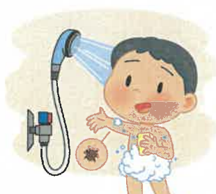
5 씻으며, 물린 흔적 찾아보고