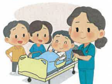
6 빨리 병원가서 치료받고