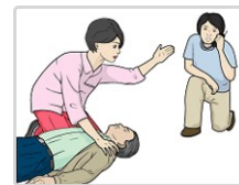
2. 119 구조요청