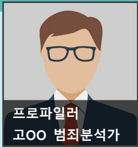
프로파일러 고OO 범죄분석가