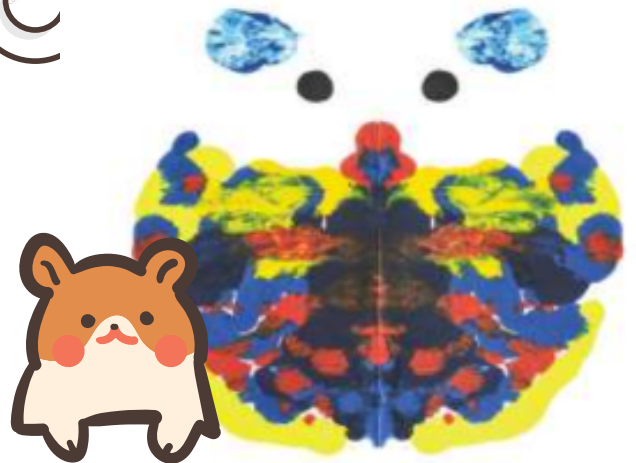
우리 집 토리(이고은)