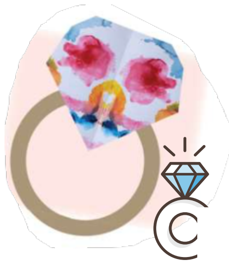
알록달록 커다란 반지 (이혜민)