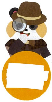
그림 완성 칠교놀이