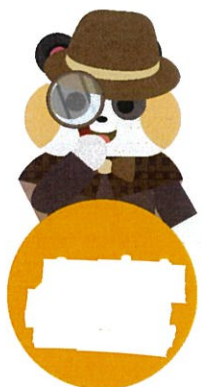
그림 찾기 미로찾기