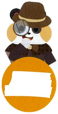
그림 완성 칠교놀이