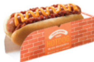
칠리치즈핫도그 칠리치즈핫도그 5,000원