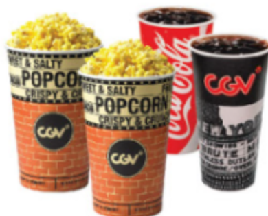
더블콤보 팝콘(M)2+탄산음료(M)2 12,000원