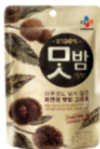
맛밤 맛밤 3,500원