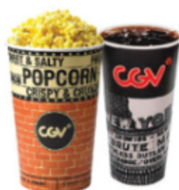
스몰세트 팝콘(M)1+탄산음료(M)1 6,500원