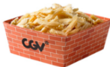
오징어(완제품) 오징어(완제품) 3,500원