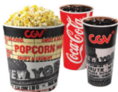
CGV콤보 팝콘(L)1+탄산음료(M)2 9,000원