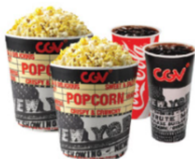
라지콤보 팝콘(L)2+탄산음료(L)2 14,000원