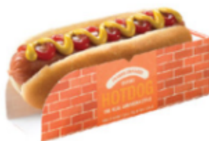
플레인핫도그 플레인핫도그 4,500원