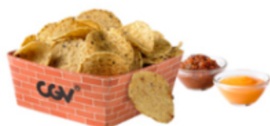
칠리치즈나초 칠리치즈나초 4,900원

3-2 내가 먹고 싶은 맛있는 음식도 구매해 봅시다. 내가 먹고 싶은 스낵에 동그라미 하거나 이름을 쓰세요.