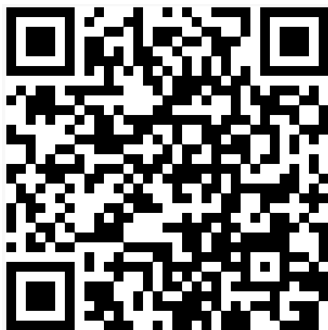
[1학년 온라인 수강 신청]