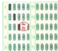
선택형 문항 수정