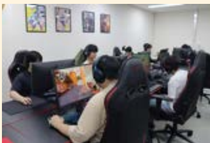
e스포츠 실습실 (아레나)