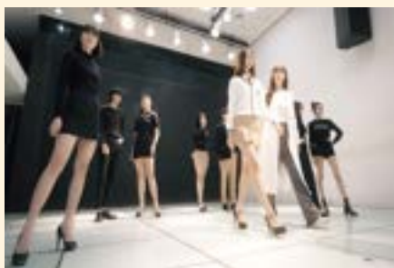
모델 실습실 (아라모드)